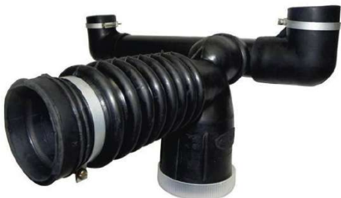
Sifón doble (1° calidad) POR UNIDAD