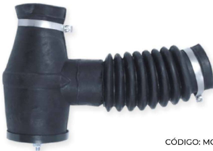
Sifón simple pvc POR UNIDAD