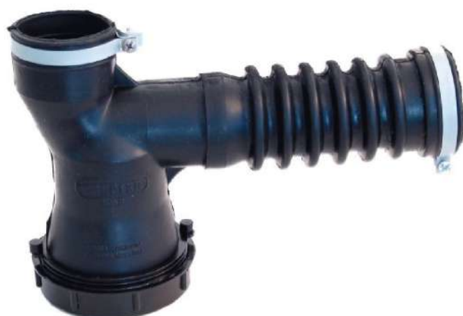
Sifón doble pvc POR UNIDAD