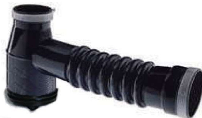
Sifón simple a codo POR UNIDAD