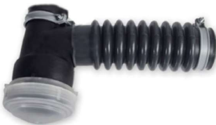
Sifón simple (1° calidad) POR UNIDAD